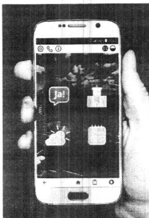
Zgłaszanie petycji w aplikacji