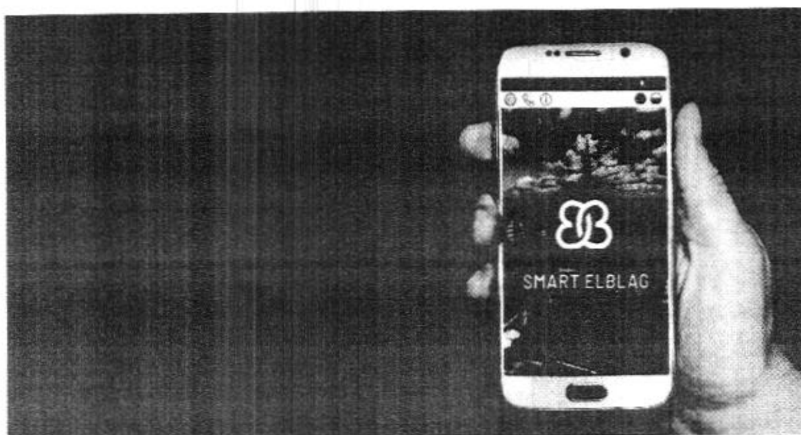
Przedstawienie logo aplikacji